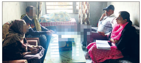
रतिया। लोगों को नशे के खिलाफ जागरूक करती नशामुक्ति टीम सदस्य।

जिला पुलिस द्वारा नशे में फंसे लोगों को इस दलदल से बाहर निकालने को लेकर चलाए जा रहे जागरूकता अभियान के तहत नशामुक्ति टीम आज रतिया के वार्ड 12 में पहुंची। एसआईटी सुंदर के नेतृत्व में नशा मुक्ति टीम ने रतिया शहर के वार्ड 12 का दौरा किया। टीम ने नशे की चपेट में आए युवाओं और नागरिकों से मिलकर उन्हें पुनर्वास एवं नशामुक्त जीवन की ओर प्रेरित किया। अभियान के दौरान वार्ड में 8 ड्रग