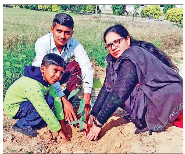
भट्टकलां। जन्मदिन पर बच्चे के साथ पौधा लगाते स्कूल प्रधानाचार्या।

पर्यावरण के लिए सकारात्मक और स्थायी उपहार