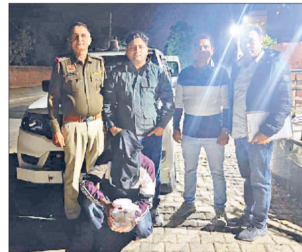
फतेहाबाद। पुलिस गिरफ्त में पिस्टल सहित गिरफ्तार युवक।