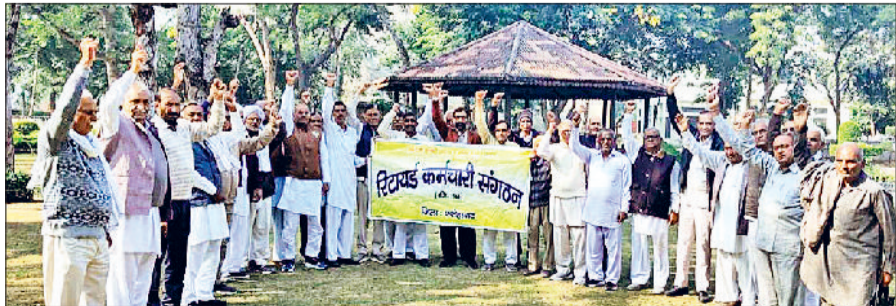
फतेहाबाद। डीसी कार्यालय पर मांगों को लेकर प्रदर्शन करते रिटायर्ड कर्मचारी।