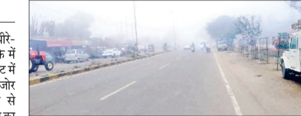
फतेहाबाद। सुबह के समय शहर में छाई धुंध।

मैदानी राज्यों विशेषकर हरियाणा में धीरे-धीरे ठंड बढ़ने लगी है। समूचा इलाके में रात्रि का पारा लुढ़क कर सिंगल डिजिट में पहुंच गया है। वर्तमान परिदृश्य कमजोर पश्चिमी मौसम प्रणालियों के असर से उत्तरी पर्वतीय क्षेत्रों पर हो रही बर्फबारी का असर मैदानी राज्यों में दिखाई दे रहा है। फतेहाबाद का रात्रि तापमान 8 डिग्री सेल्सियस चौथे स्थान पर रहा है। यह सामान्य से 2 डिग्री सेल्सियस कम रहा। अधिकतर स्थानों पर दिन के तापमान सामान्य से नीचे बने हुए हैं। हालांकि दिनभर सूर्य की चमकदार धूप खिली रहने से दिन के समय आमिल को कड़ाके की ठंड से राहत भी मिल रही है। फतेहाबाद शहर का वीरवार को अधिकतम तापमान 23 डिग्री सेल्सियस दर्ज किया गया जबकि न्यूनतम तापमान 9 डिग्री रहा।