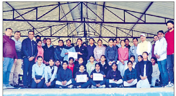
चोपटा। प्रतियोगिता की विजेता टीम को सम्मानित करते हुए।

प्रतियोगिता में कक्षा 9वीं व 11वीं के करीब 50 बच्चों ने भाग लिया