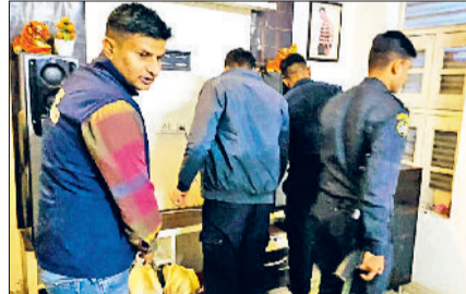
रतिया। तलाशी अभियान चलाते पुलिस कर्मचारी।

मुख्य चौक, बस स्टैंड, बाईपास, बाजार और अन्य संवेदनशील स्थानों पर संधिध वाहनों, राहगीरों और ठिकानों की कड़ी जांच और सघन चेकिंग की गई। डॉग स्क्वाड के जैक और रेन्बो की तेज सूंघ और कमांडो बल की तत्पर कार्रवाई ने नशा तस्करो को चौकन्ना कर दिया। कई स्थानों पर सख्त चेकिंग से अपराधियों में डर पैदा हुआ और आम जनता में सुरक्षा का भरोसा और