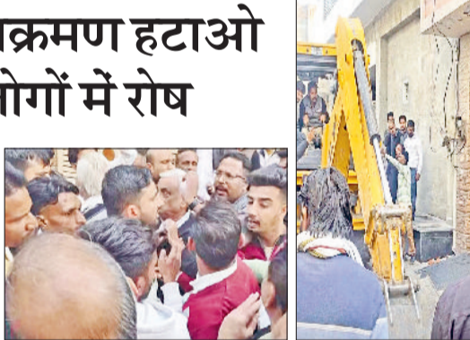
सिरसा। तोड़फोड़ करती जैसीबी मशीन, अधिकारियों का धेराव करते लोग।

डबवाली में वीरवार को नगर परिषद की ओर से अतिक्रमण हटाओ अभियान चलाया गया। लेकिन जैसे ही वार्ड नंबर 14 में यह अभियान शुरू हुआ तो लोगों ने इसका विरोध किया। वार्ड नंबर 14 में इस अभियान की शुरुआत कैसे हुई यह भी लोगों के समझ नहीं आया। नगर परिषद के अधिकारी पुलिस बल के साथ जैसीबी मशीन लेकर वार्ड नंबर 14 में आ पहुंचे और अभियान शुरू कर दिया। लोगों के घरों के बाहर बने थडें व गेट के रैप धड़ाधड़ करके टूटने शुरू हो गए। लोगों को जैसे ही इसका पता चला सैकड़ों की तादाद में इलाके के लोग विरोध में उतर आए। लोगों ने अधिकारियों का धेराव कर जवाब तलबी की। लोगों ने पूछा कि आखिर 14 नंबर वार्ड को अभियान के लिए क्यों चुना गया।